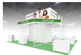
※ブースイメージ （参考：前回出展時）